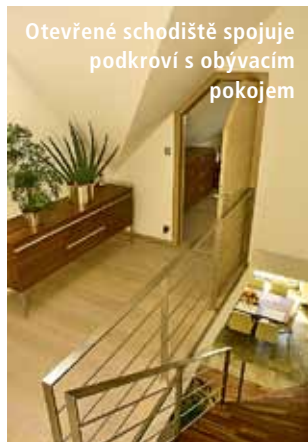
Otevřené schodiště spojuje podkroví s obývacím pokojem