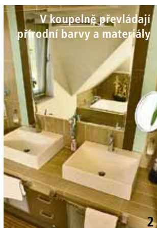
V koupelně převládají přírodní barvy a materiály