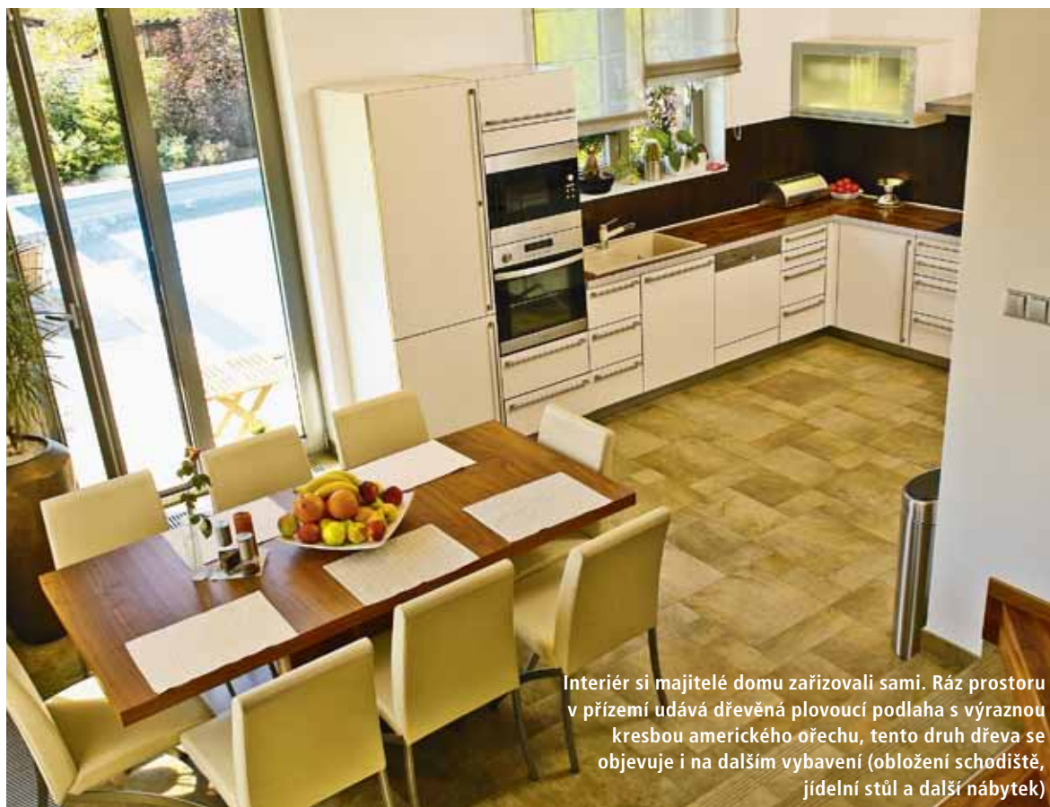
Interiér si majitelé domu zařizovali sami. Ráz prostoru v přízemí udává dřevěná plovoucí podlaha s výraznou kresbou amerického ořechu, tento druh dřeva se objevuje i na dalším vybavení (obložení schodiště, jídelní stůl a další nábytek)